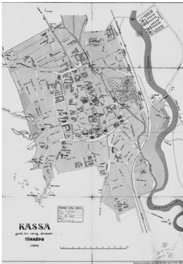
Obrázok 2: mapa Kassa szab. kir. város átnézeti térképe, 1906, Nyulászi

Do začiatku XX. storočia vývoj mesta zaznamenal pokrok, ktorý môžeme sledovať na aktuálnej mape mesta 4 a porovnať s Homolkovým plánom, ktorý zachytáva stav r. 1869. Na Homolkovom pláne je vidieť, že historické jadro mesta je zo severu, západu a juhu obkolesené nezastavanými plochami, ktoré vznikli na mieste zbúraného opevnenia a zasypaných priekop. Sú to zárodoky námestí Františka Jozefa – Ferencz József tér (dnes Maratónu mieru) a Erzsébet tér – Alžbetínske nám. (dnes Osloboditeľov) ako aj širokej Rákócziho okružnej – Rákóczi körút (dnes Moyzesovej) s alejou. Za nimi stoja predmestia Košíc - huštáky. Na východnej strane zas zástavba končí Mlynským náhonom, za ktorým stojí už len železničná stanica a vtedajší Kertész tér, zárodok dnešnej ul. Masarykovej. O niečo viac ako 30 rokov sa zrealizovali niektoré návrhy horeuvedenej komisie, ako pretvorenie lúky pred stanicou na park, pretvorenie voľných priestranstiev na juhu a severe v námestia a z veľkej časti zastavanú západnú stranu Rákócziho okružnej verejnými budovami. Mesto je teda zrastené s niekdajšími predmestiami a zároveň plošne rozšírené po celom svojom obvode. Nápadným rozdielom je aj množstvo kasární a vojenských objektov, ktoré za ten čas pribudli a vťahili mestu nový charakter posádkového mesta – sídla okruhového veliteľstva.